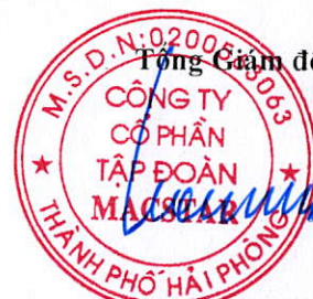
Cấp Trọng Cường