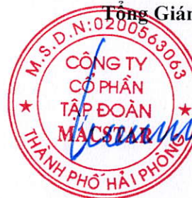
Cáp Trọng Cường